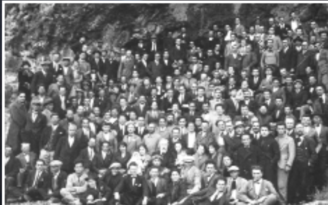
Confinati politici negli anni del Fascismo, a Ventotene, prigione di molti patrioti.

Tra luce e ombra: acque trasparenti e grotte da esplorare , in barca e a nuoto, lungo il periplo di Ventotene.