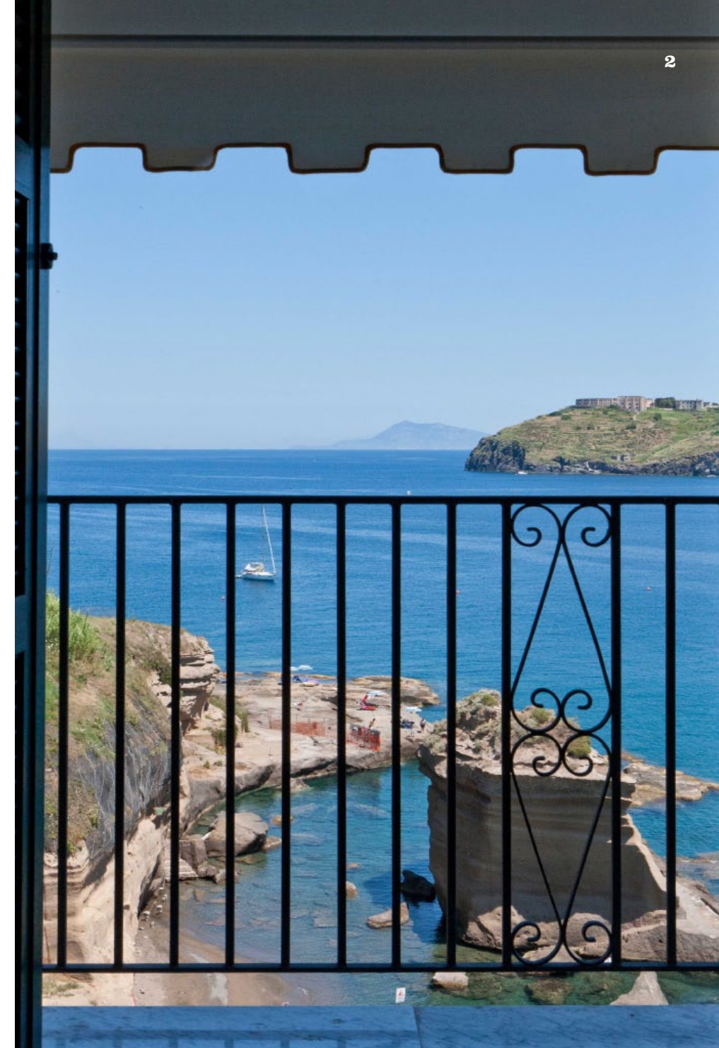
1. Il ristorante Il Giardino . Si cena con circa 50 € . 2. Vista dall' hotel Mezzatorre , sul mare. Doppia b&b da 140 €. 3. Noleggio barche al Porto Romano . 4. L'albergo Villa Iulia .