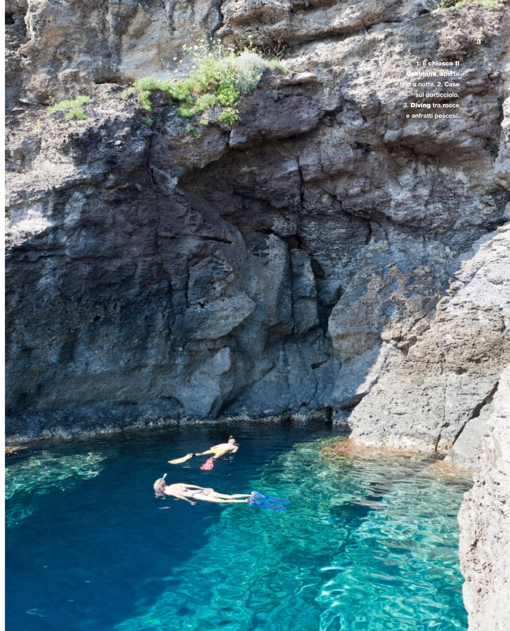
1. Il chiosco Il Gabbiano, aperto fino a notte. 2. Case sul porticciolo. 3. Diving tra rocce e anfratti pescosi.